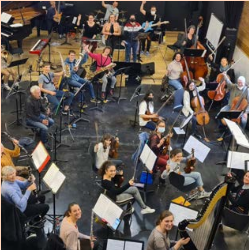
L'orchestre symphonique en répétition - mai 2022

Et pourtant, depuis les années 70, les établissements d'enseignement artistique ne cessent d'emboîter le pas de l'immense foisonnement artistique mondial : espace de création, de formation amateur ou professionnelle, les conservatoires accueillent désormais tous les publics, toutes les esthétiques, toutes les disciplines artistiques et proposent des cursus de formation adaptés ou personnalisés, pour chacun.