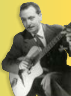
Django Reinhardt en est un bel exemple !

Non, il ne faut pas d'abord savoir lire une partition pour faire de la musique