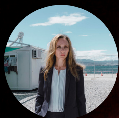
Eden (épisode 1) de Dominik Moll