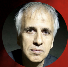
Bruno Coulais, compositeur