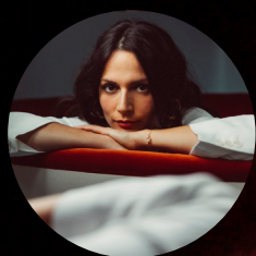
Nach ©Maud Chalard