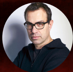
Dominik Moll, réalisateur