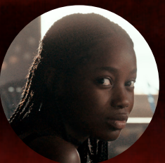
Atlantique de Mati Diop Grand Prix Cannes 2019